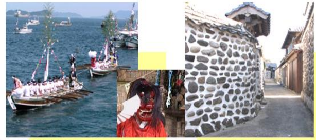
Y 神舞(かんまい): 大分・国東半島の伊美別宮社の神職が、4年に一度、祝島にて報恩感謝の神樂を奉納する、千百年も続いている祭事。

（山口県上関町・教育委員会・教育委員長、祝島神舞奉賛会・会長、広島工業大学「地域・集落計画研究センター」顧問）